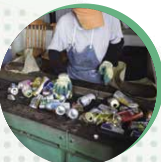
▲資源物の仕分け作業の様子