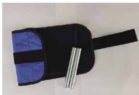
▲市から無償貸与される「バンド・おもり」