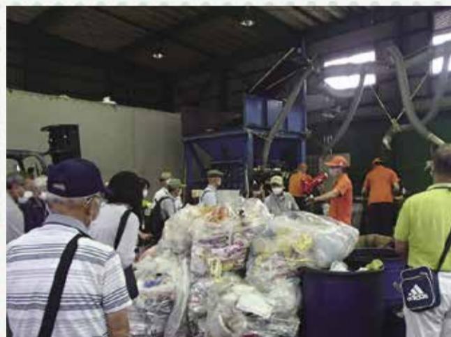
▲作業工程の説明を聞く参加者

ごみ処理施設やリサイクル施設の他、印西クリーンセンターで発生するごみ焼却熱を地域冷暖房に利用しているエネルギーセンターなどを見学し、ごみの分別と減量化の大切さを学ぶバスツアーです。