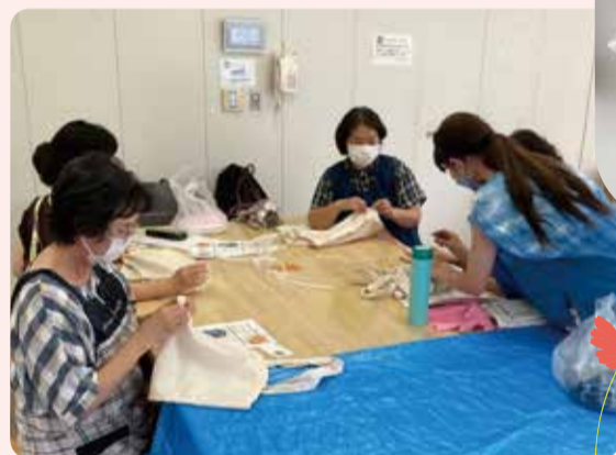
▲藍染めのチャリティーイベントの様子