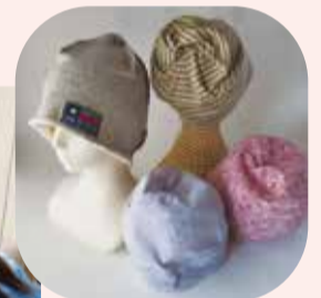
▲寄付しているさま ざまなニット帽子