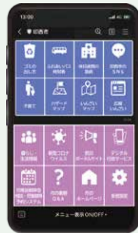
▲トーク画面イメージ