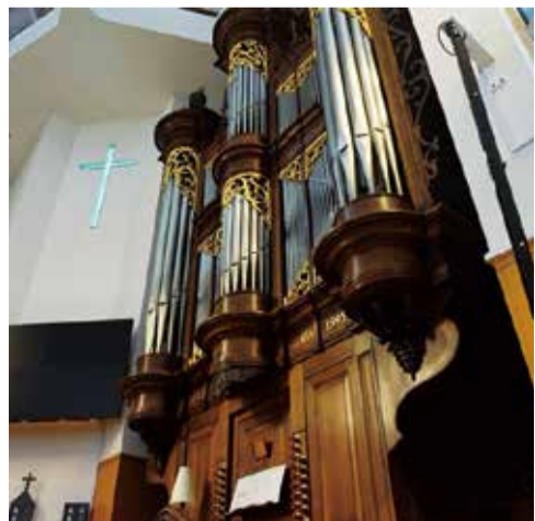
▲東京芸術劇場のオルガンも手掛けたマルク・ガルニエ作のパイプオルガン

千葉ニュータウン中央駅南口を出て、ニュータウン大橋から県立北総花の丘公園の緑豊かな遊歩道を南にたどると、途中に東京基督教大学の正門が見えます。このキャンパスの森の中に、昨年末他界された世界的建築家、磯崎新氏設計によるチャペルが祈りの場として建っています。外観は三つの球が体を寄せ合い、せめぎ合っているような独特のデザインで、隣に建つ天空に向かう鐘楼が、何か強い意志を感じさせます。