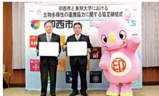
▲協定を締結した東邦大学・高松学長(左)と板倉市長