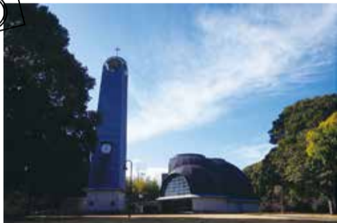
▲木々に囲まれ静かに建つチャペル