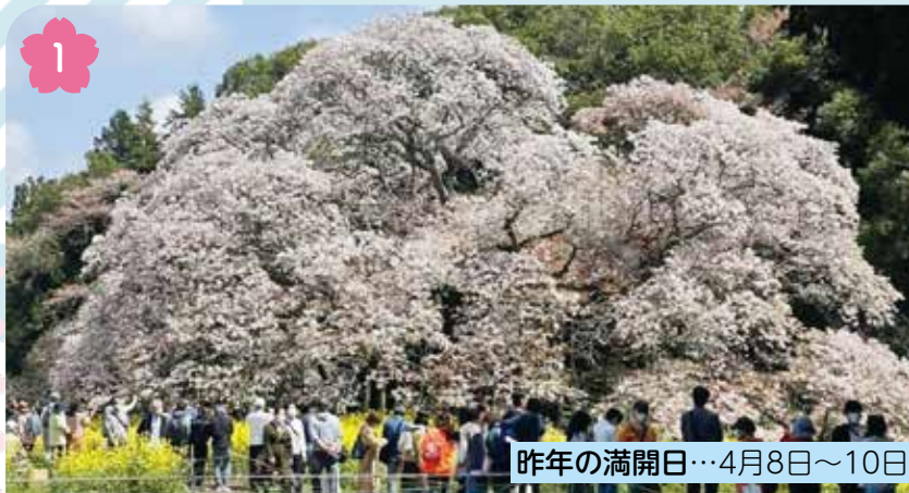
1 昨年の満開日...4月8日~10日

市内各地で咲き誇る桜が、新しい季節の始まりを伝えてくれます。暖かな日差しとともに春の訪れを感じてみませんか。