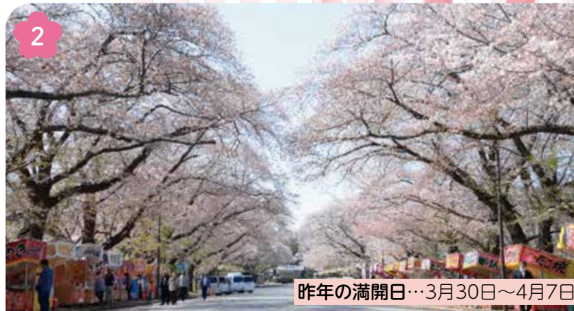
2 昨年の満開日...3月30日~4月7日