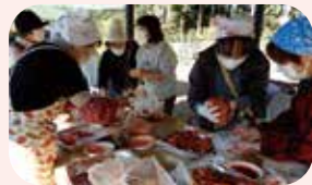
▲ヴィトラファームで開催されたキムチ漬け体験