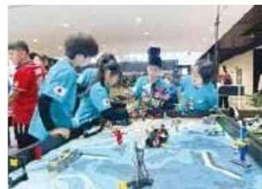
▲チーム「INZAI トルマリン」の皆さん

生徒たちは、大会に出る前に市役所へ行き、頑張る気持ちを話しました。大会後の7月25日、5人はまた市役所へ行き、市長たちに世界大会の結果を報告しました。