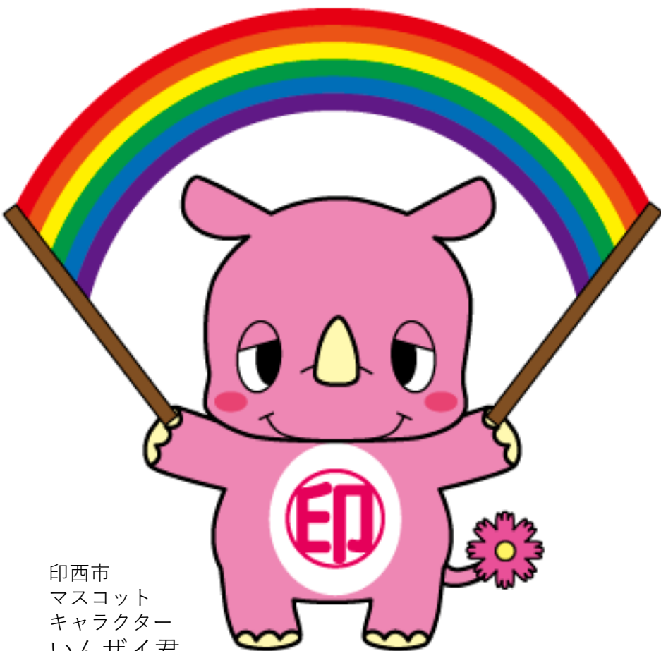
印西市 マスコット キャラクター いんざい君