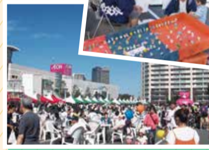
写真は過去に開催されたいんざいふるさとまつりの様子