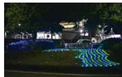
実施例(昨年の様子)