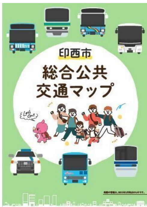
<印西市総合公共交通マップ>