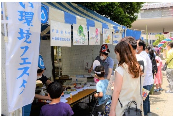
<いんざい環境フェスタ>

○環境負荷の低減を図るため、定置用リチウムイオン蓄電システムの設置や合併処理浄化槽などの設置助成を行いました。