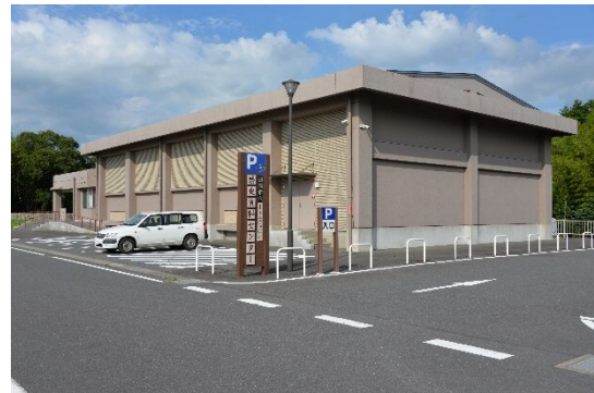
＜木下交流の杜歴史資料センター＞

○印旛歴史民俗資料館、木下交流の杜歴史資料センターにおける常設展や体験講座を実施するとともに、市史研究誌の刊行などにより市民の郷土意識の涵養を図りました。