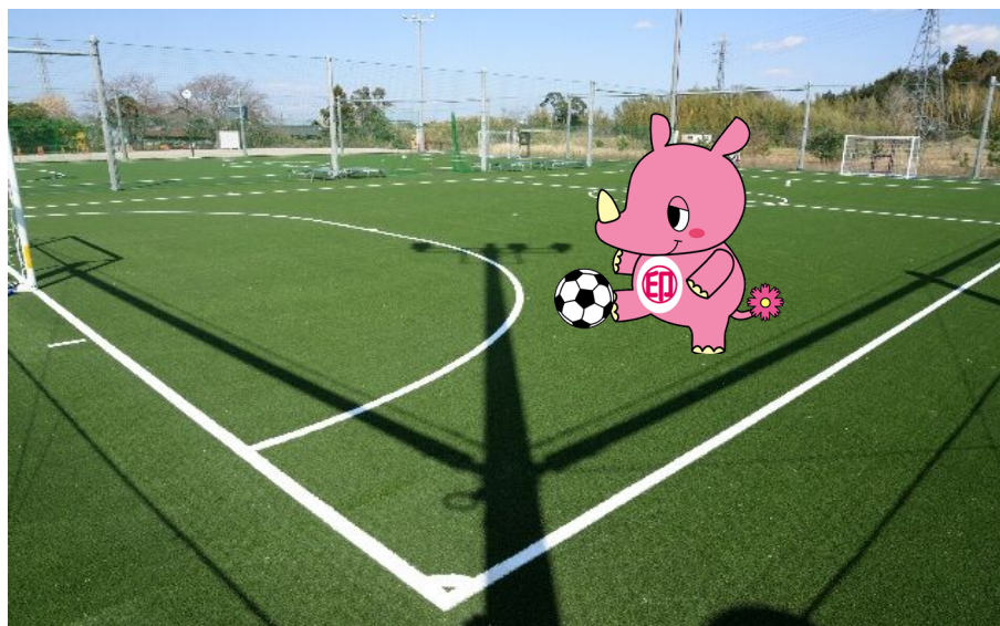
<木下交流の杜コスモスフットサルパーク>

○印西市スポーツ協会やスポーツ少年団などの活動への支援を行い、競技力の向上及びスポーツ人口の増加を図りました。