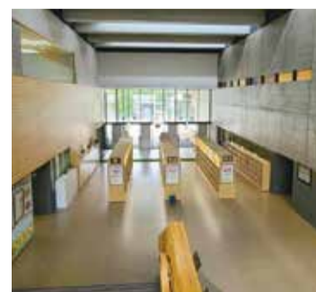
圧巻の玄関ホール