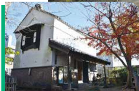
◀吉岡まちかど博物館