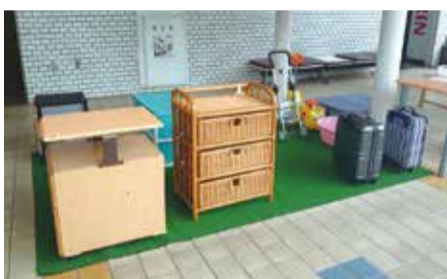
▲展示品のイメージ