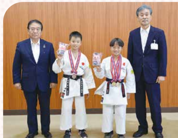
▲左から板倉市長、紫水さん、太陽さん、大木教育長