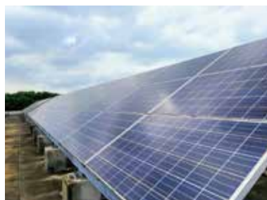
屋上の太陽光パネル