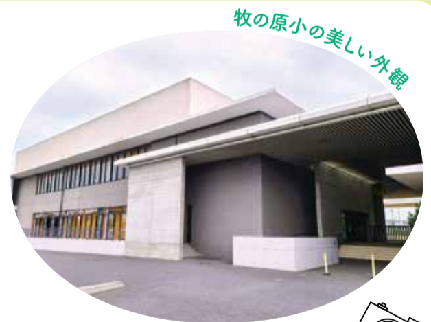
牧の原小の美しい外観

来年開校10周年を迎える牧の原小学校。これからもずっと、子どもたちにとって自慢の小学校であり続けてください。