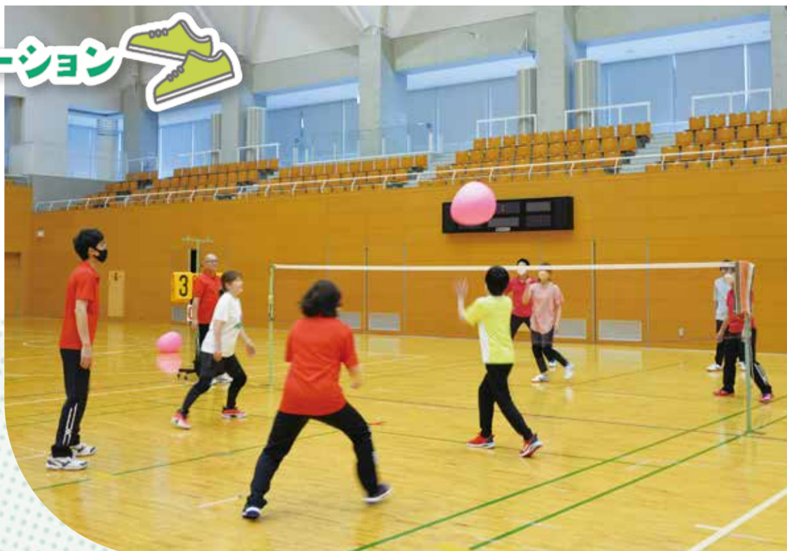
▲ワンバウンドふらばーるバレーボール

問 スポーツ振興課振興係 ☎42-8417 ✉sportska@city.inzai.chiba.jp ☎42-8427