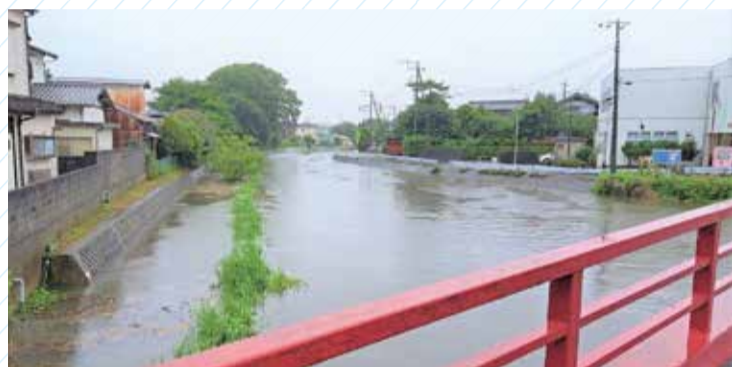
令和5年6月5日・台風2号による河川増水