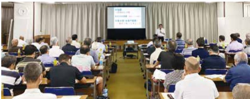
市民活動推進課活動支援係 ☎33-4431

各町内会などの相互の親睦と連帯を図り、地域の環境改善に努め、地方自治の発展に寄与することを目的として活動しています。また、市政学習会や研修会など、各種事業も実施します。