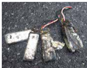
▲発火した充電式製品

捨てるときは、適切な分別をお願いします。 ☎印西クリーンセンター業務班☎46-2732