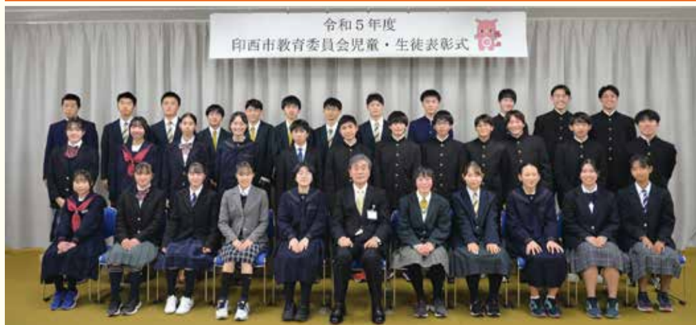
表彰された中学生の皆さん