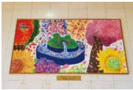
100人の手による手形アート