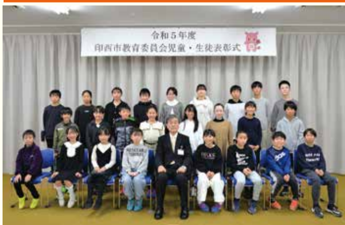
表彰された小学生の皆さん