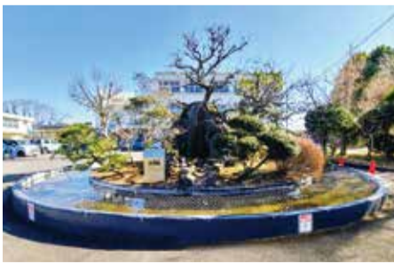
船穂小のシンボル「ドーナツ池」