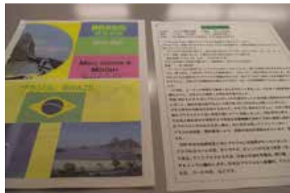
配布されたブラジルの資料