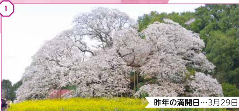
① 吉高の大桜 市指定天然記念物 昨年の満開日...3月29日

市内各地で咲き誇る桜が、新しい季節の始まりを伝えてくれます。暖かな日差しとともに、季節の移り変わりを感じてみませんか。 ※満開日は気候などにより変わります 問 経済振興課プロモーション推進室 ☎33-4477