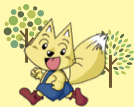
▲市環境キャラクターエコネ