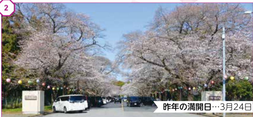
② 小林牧場の桜 房総の魅力500選 昨年の満開日...3月24日