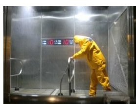
◀西部防災センター見学