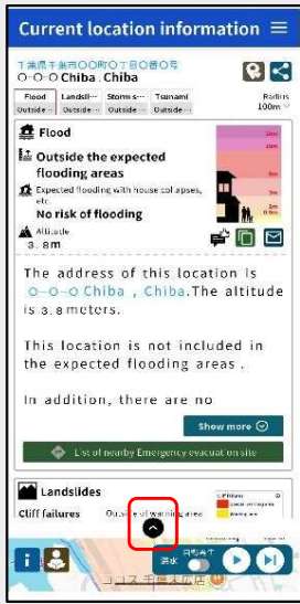
③ハザードマップの画面