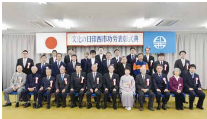
市功勞表彰を受賞した皆さん