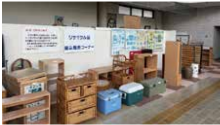
▲展示品は都度更新しており、すでに売却済みの品もありますのでご注意ください