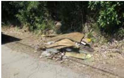
▲道路脇に不法投棄された産業廃棄物

◎不法投棄を見かけたときは…不法投棄者の特徴や不審車両のナンバーなど、分かる範囲の情報を下記へ通報してください。