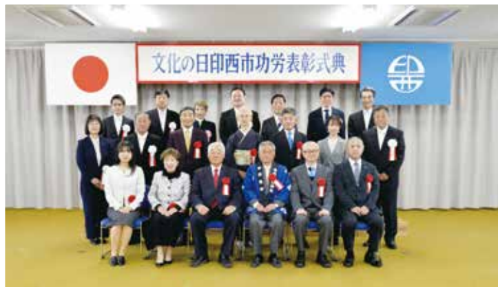
教育委員会表彰を受賞した皆さん