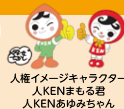
人権イメージキャラクター 人KENまもる君 人KENあゆみちゃん

法務省と全国人権擁護委員連合会では、世界人権宣言が採択された昭和23年12月10日にちなんで人権週間を定め、世界人権宣言の意義を訴えるとともに、人権尊重思想の普及高揚に努めています。