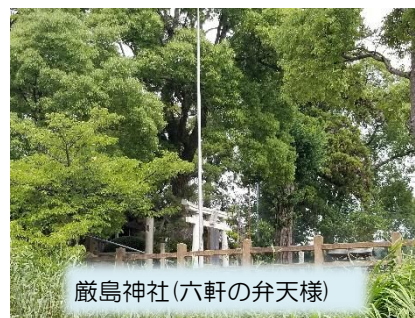
巖島神社(六軒の弁天様)