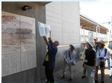
JR 木下駅の案内説明版