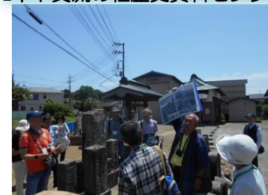
上町観音堂の庚申塔