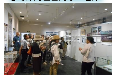
木下交流の杜歴史資料センター