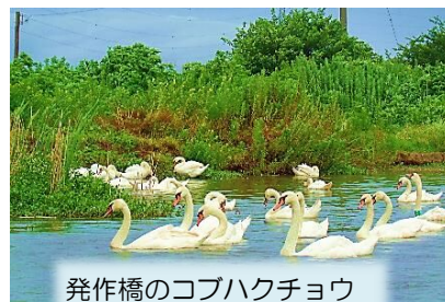
発作橋のコブハクチョウ