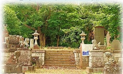
二対の狛犬がある山根山不動尊