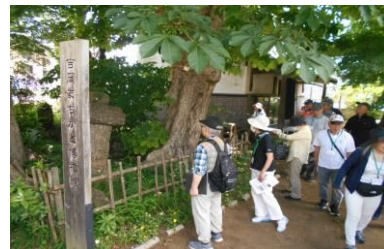
河岸問屋吉岡家の倉庫