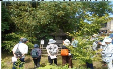
木下貝層で作られた灯籠