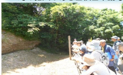
国天然記念物の木下貝層