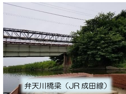
弁天川橋梁 (JR 成田線)