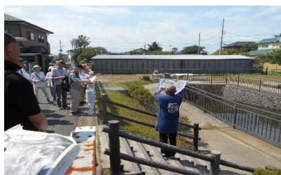
東洋一を誇った手賀沼排水機場

木下河岸は江戸から明治にかけ、利根川水運の要衝の地として大いに栄え、文化・文政年間(1804~1830年)には利根川を下って、香取、鹿島、息栖の三社を参拝し銚子の磯を楽しむ、「木下茶船」の旅が大流行し、最盛期には50軒あまりの旅籠や飲食店が軒を連ねていました。さらに明治時代になると蒸気船が就航し、年間約3万人の人が木下に宿泊し、まちは大いに賑わったといえます。しかしその後の成田鉄道の開通による木下駅などの開業と、利根川の河川改修に伴い、木下河岸周辺の家々が木下駅周辺に移転したため、木下河岸はその役割を終えました。残念ながら往時の建造物はほとんど残っていませんが、その痕跡を訪れ、講師の先生に用意していただいた当時の写真を見ながら、栄華を極めた木下河岸地区の歴史を学ぶ貴重な機会となりました。コースは、中央公民館→武蔵屋→旧木下橋→木下河岸跡→山根山不動尊→吉岡問屋倉庫→木下交流の杜歴史資料センター→木下貝層→上町観音堂→木下小学校・印旛高校発祥の地→木下駅→中央公民館です。天候にも恵まれ、心地よい散策となりました。