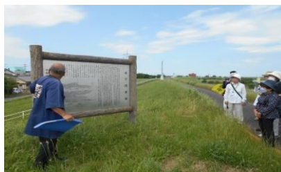
木下河岸跡の説明版