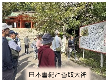
日本書紀と香取大神

東国三社とは、鹿島神宮（茨城県）、香取神宮（千葉県）、息栖神社（茨城県）の三つの神社を指し、国譲り神話に由来することで、昔から信仰を集めていた関東有数のパワースポットです。江戸時代になると、江戸の文人墨客、庶民の東国三社（鹿島神宮、香取神宮、息栖神社）を巡拝する旅が盛んになり、日本橋小網町を小舟で出発し、小名木川・新川・江戸川を經由して行徳河岸に至り、そこから徒歩で木下河岸に向かい、木下茶船に乗り、利根川を下って三社に向かいました。記録には、木下河岸を出る船数は、安政年間(1772～)には、年間約4,400～4,500隻にも達していて、往時の木下河岸の繁栄がうかがえます。今回は、船に代わりバスで三社を巡り、その魅力を探る旅に出ました。