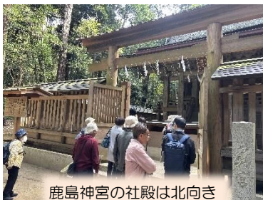
鹿島神宮の社殿は北向き

10月31日(木)、印西市役所を出発し、利根川沿いの道を約1時間走り香取神宮に到着。朱色の二の鳥居から入り、大きな石灯籠が並ぶ坂道を登っていき、総門・楼門をくぐり本殿へ。本殿は、檜皮葺、黒漆を基調とした色合いに極彩色で彩りを加え、御神意の大きさを感じさせます。次に楼門より旧参道を西へ進み、地震を起こす大鯨を抑えるため地中深くまで差し込んでいるとされる霊石「要石」に立ち寄り、さらに経津主大神の荒魂を祀る「奥宮」を参拝して終了。鹿島神宮に向かう。