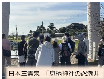
日本三霊泉：「息栖神社の忍潮井」

鹿島神宮の大鳥居から入り、日本三大楼門の一つに数えられる楼門をくぐり、本宮、摂社の高房社を参拝。本殿の檜皮葺の屋根の美しさが目を引きます。参拝後、鬱蒼とした巨木に覆われ荘厳な雰囲気醸し出している奥参道を歩み奥宮に向かう。途中、「さざれ石」と「鹿園」に立ち寄り。奥宮の前の旧坂を下り、古くからの禊の場である御手洗池に向かう。御手洗池のほとりに、樹齢600年の杉の巨木の切り株が残っている。これは、東日本大震災で倒壊した御影石製の鳥居に替わり、境内に自生する杉の巨木を用いた同寸法の大鳥居を再建したおりに使われた巨木の1本である。急坂を上り、地震を起こす大鯨の頭を押さえている鎮石ともいわれる「要石」を見学し、昼食後、息栖神社に向かう。