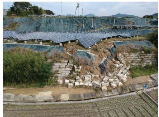
法面保護工が崩れて流出した事例