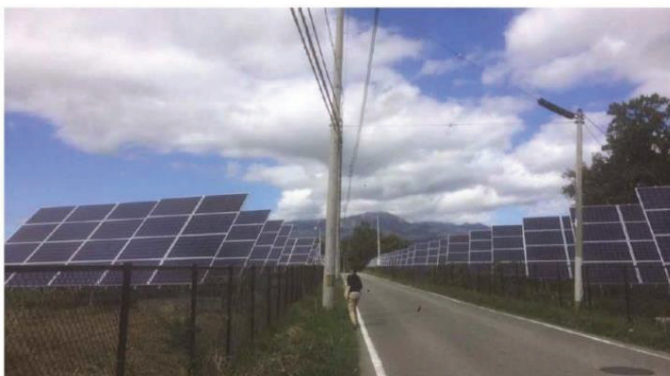
山岳パノラマ景観を阻害している事例

本市においては、再生可能エネルギーの最大限の利用促進と、本市の最大の魅力である自然環境を守る視点を踏まえて、地域に受け入れられる設置・運用の在り方について、市民・事業者・行政が一体となって検討していきます。