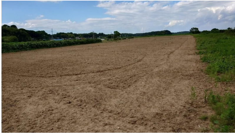
市有地①（印西市師戸干拓 280 番地 1）