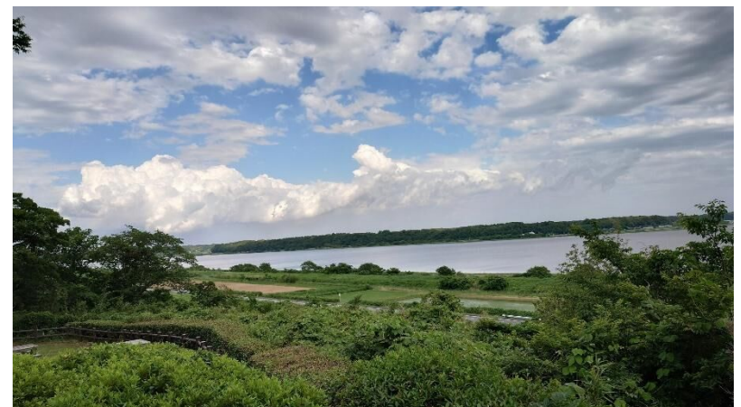
千葉県立印旛沼公園から農地を望む