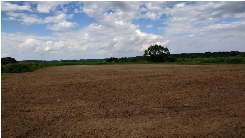
市有地③（印西市師戸干拓 284 番地 1）