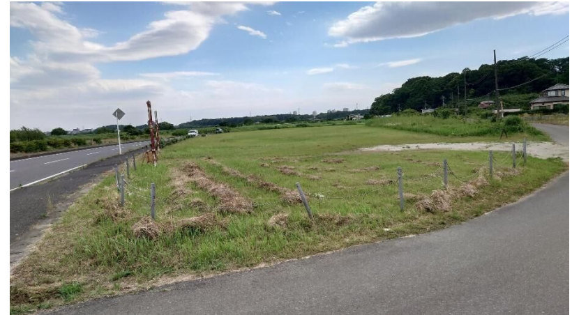
市有地②（印西市師戸干拓 280 番地 3）