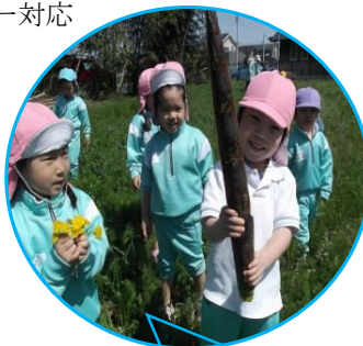
秋のお芋の収穫を期待しながら 「大きく大きくなあれ！」