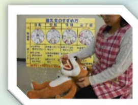
歯科衛生士による講話の様子

※随時、電話やメールでも相談を受け付けています。 詳細につきましては子育てナビ「離乳食に関する教室・相談」のページをご覧ください。