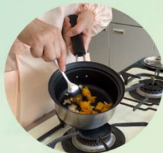
調理デモンストレーションの様子