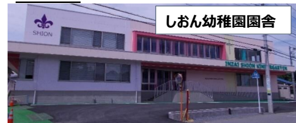
しおん幼稚園園舎