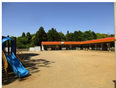
ぴよぴよのお部屋